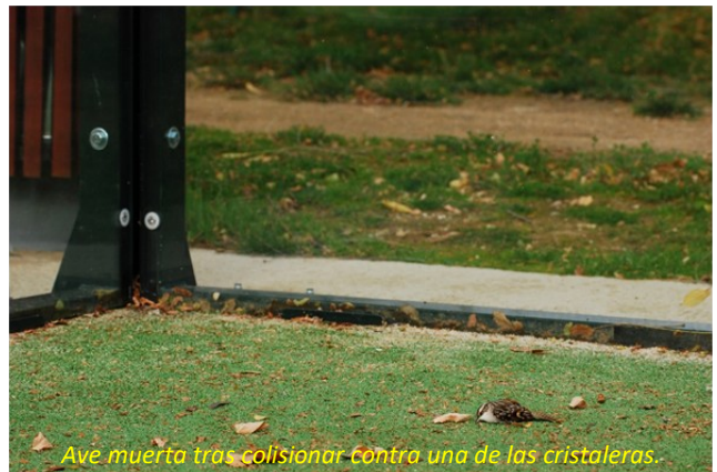
Ave muerta tras colisionar contra una de las cristaleras.