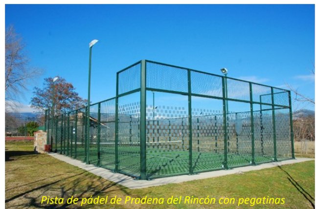
Pista de pádel de Pradena del Rincón con pegatinas