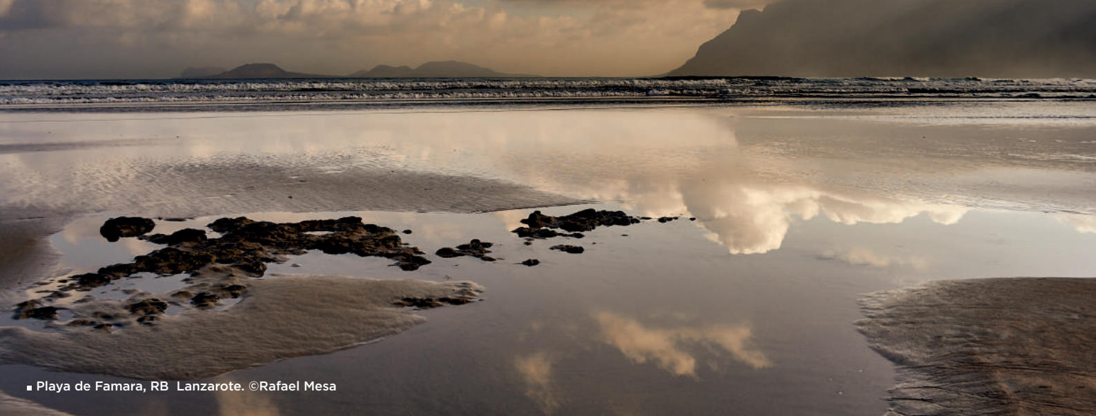
■ Playa de Famara, RB Lanzarote.