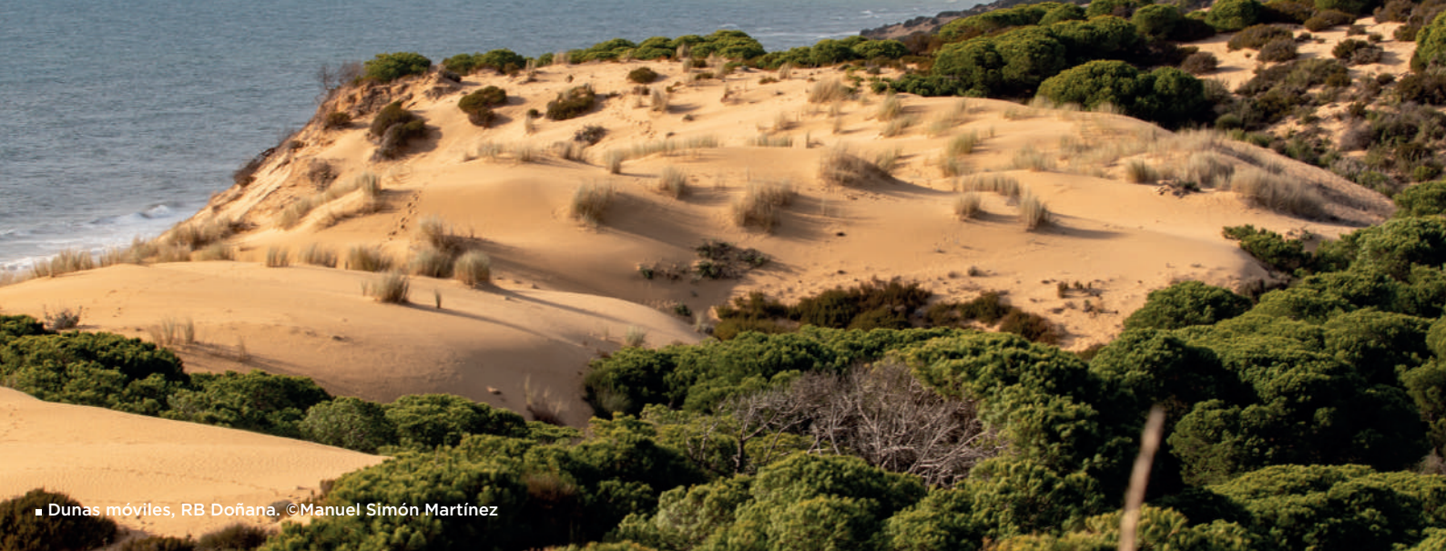
■ Dunas móviles, RB Doñana.