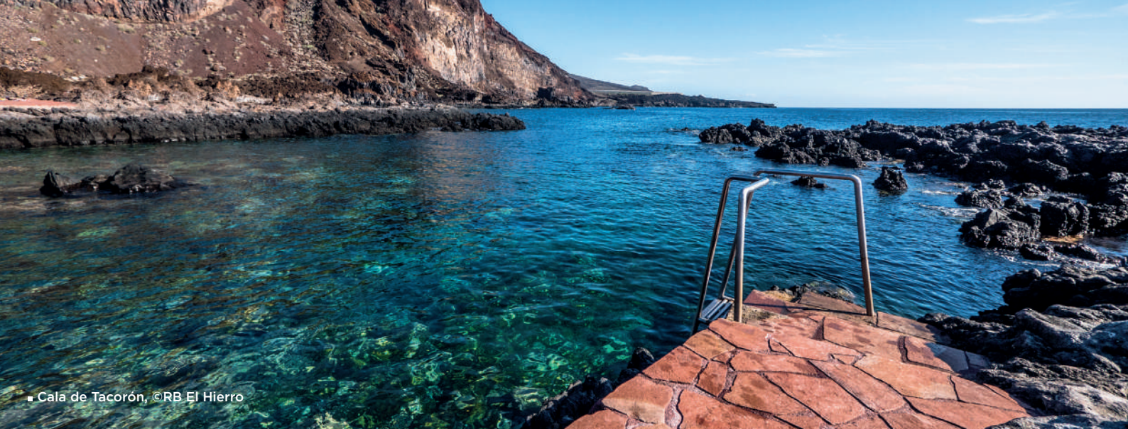
■ Cala de Tacorón