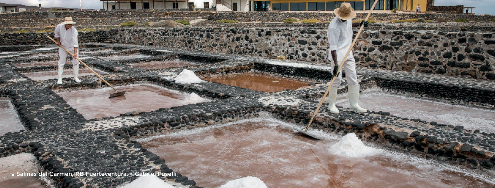
■ Salinas del Carmen, RB Fuerteventura.