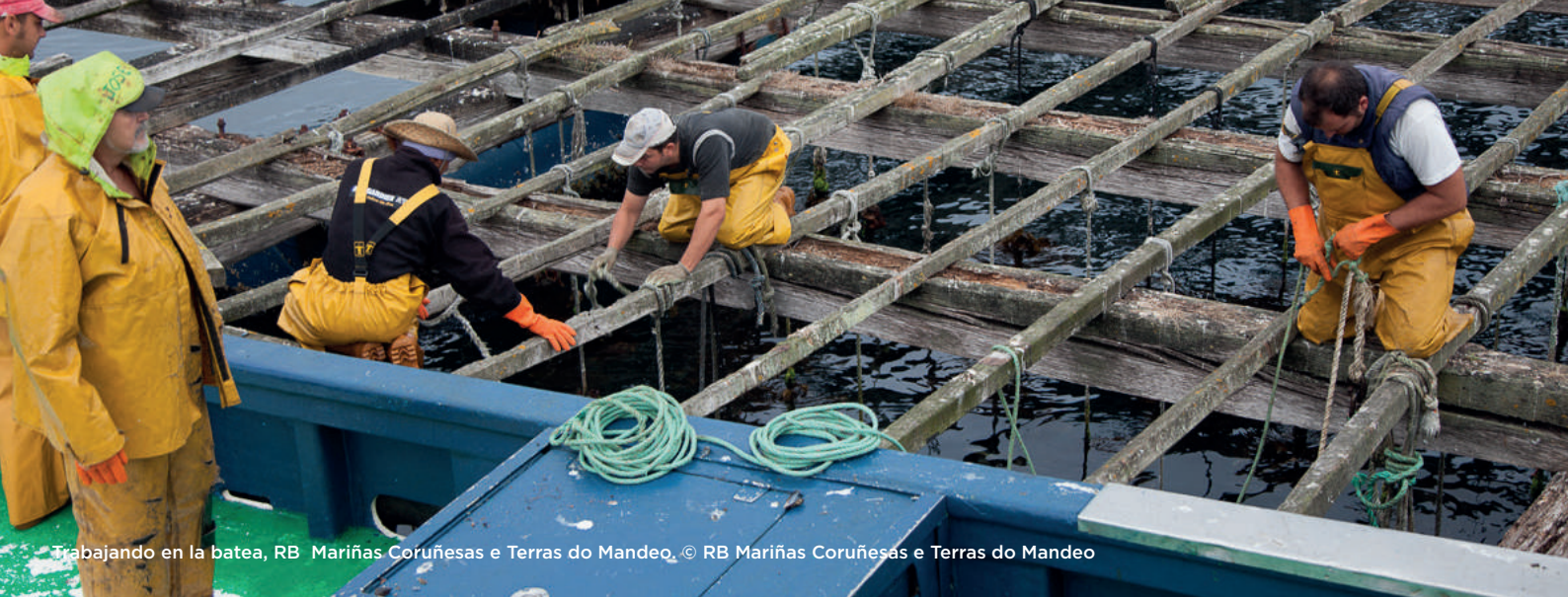
Trabajando en la batea, RB Mariñas Coruñesas e Terras do Mandeo.