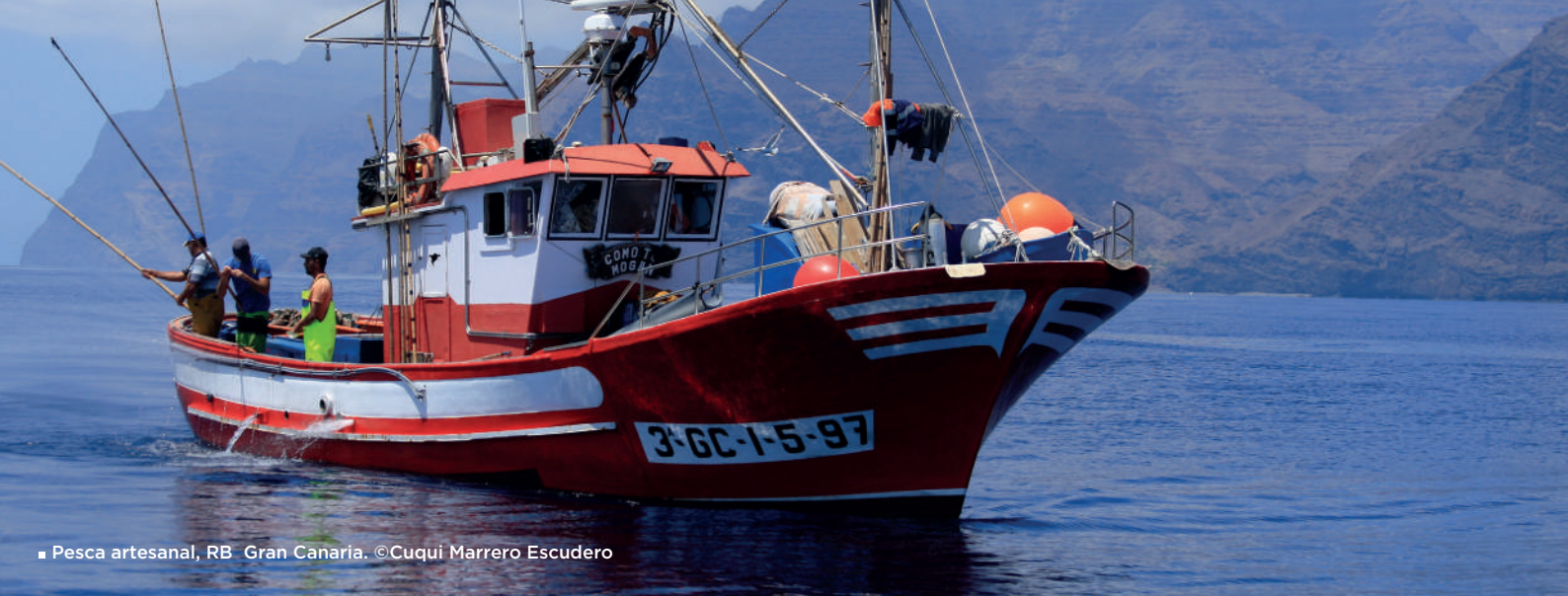
■ Pesca artesanal, RB Gran Canaria.