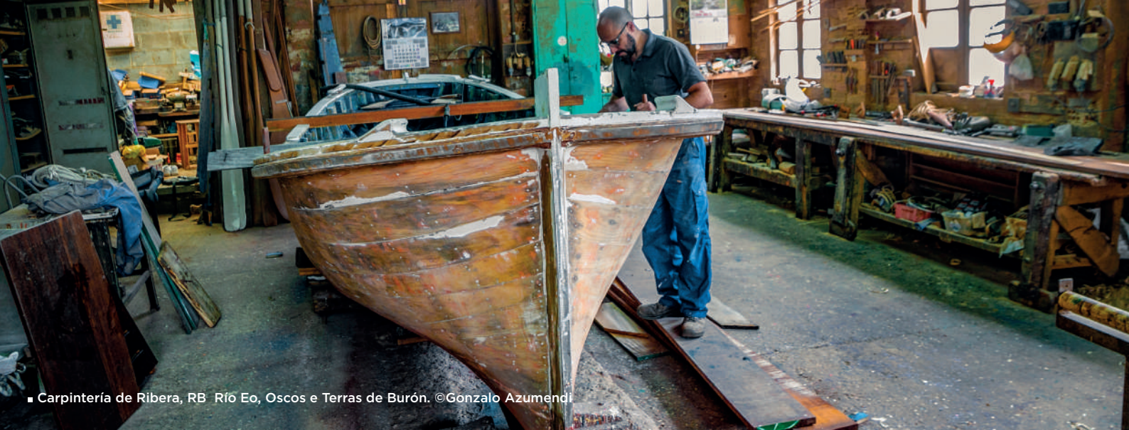
■ Carpintería de Ribera, RB Río Eo, Oscos e Terras de Burón.