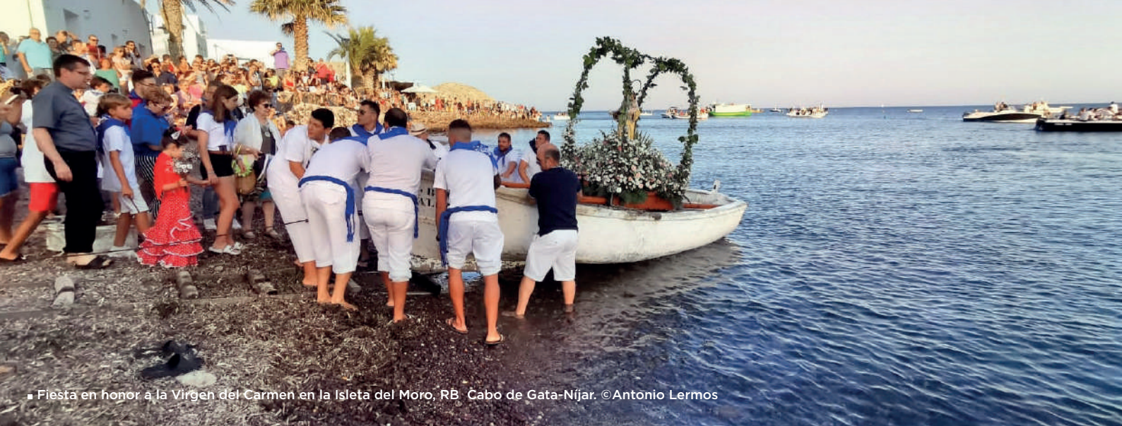
■ Fiesta en honor a la Virgen del Carmen en la Isleta del Moro, RB Cabo de Gata-Níjar.