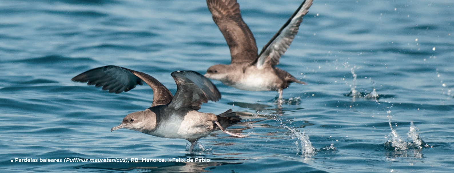
■ Pardelas baleares ( Puffinus mauretanicus ), RB Menorca.