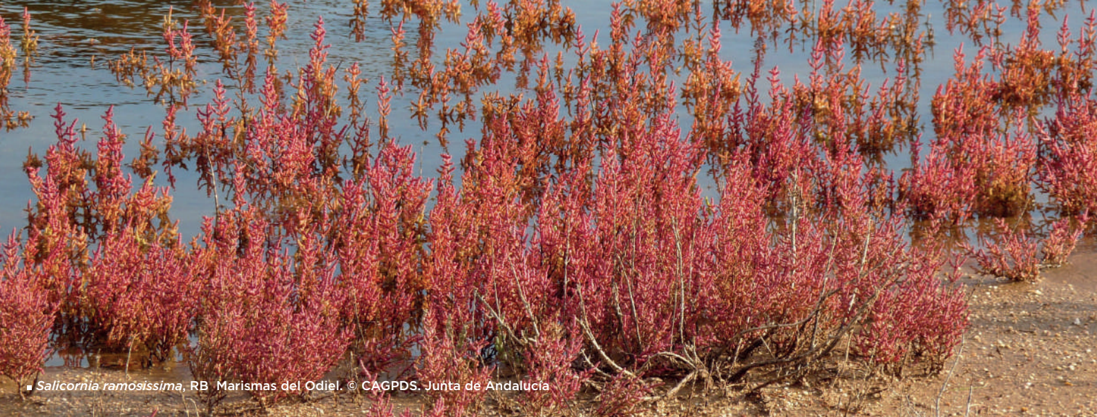
■ Salicornia ramosissima , RB Marismas del Odiel.