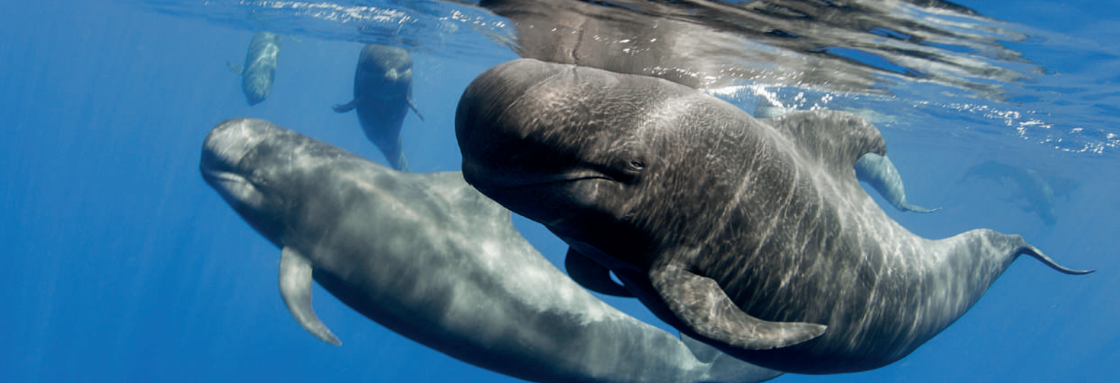
■ Calderón tropical ( Globicephala macrorhynchus ), RB Macizo de Anaga.