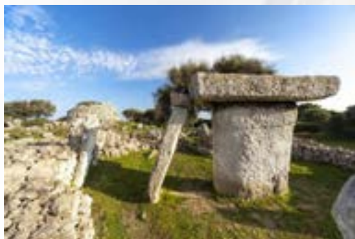
Poblado Talayótico de Talatí de Dalt

Y es que la densidad de yacimientos arqueológicos en Menorca es también insólita, así como la peculiar integración con el paisaje que presentan. La isla, con una superficie de 700 Km 2 , tiene 1.574 yacimientos arqueológicos, es decir, en Menorca hay dos monumentos por kilómetro cuadrado, sin duda “única en el mundo”.