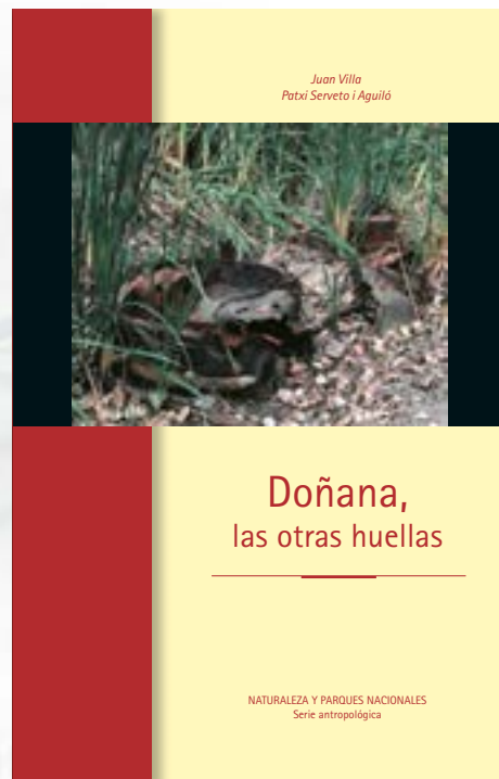
Cubierta del libro «Doñana, las otras huellas».

La iniciativa de desarrollar esta sección de relatos semanales formó parte de un proyecto de investigación más genérico, «Doñana en la narrativa», que el escritor llevó a cabo en Doñana a lo largo del año 2011, y prorrogado el siguiente aunque en parte continúa en la actualidad; el proyecto fue promovido por el Espacio Natural de Doñana (Consejería de Agricultura, Pesca y Medio Ambiente; Junta de Andalucía), quien también prestó el apoyo institucional, administrativo y logístico necesario, y ha contado así mismo con la colaboración de la Estación Biológica de Doñana (Consejo superior de Investigaciones Científicas; Ministerio de Economía y Competitividad).