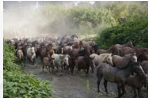
Yeguas y potros en «la pasá del chivo», camino de la Feria de Almonte tras salir de Doñana.

Desde entonces, todos los días 25 de junio por la tarde los yegüerizos se adentran en las marismas del Parque Nacional, donde el ganado ha estado pastando todo el invierno en estado semisalvaje, para reunir durante la madrugada por grupos, hasta dieciocho de las denominadas «tropas», los equinos en un lugar cercano a la aldea de El Rocío, desde donde son escoltados hasta la población de Almonte, sita unos 15 kilómetros. Es precisamente el paso de la manada ante la ermita de la Virgen del Rocío uno de los momentos que despiertan mayor expectación y que congrega anualmente a cientos de personas, habiéndose acreditado este año quince medios de comunicación ante la Administración de Doñana; este año ha aumentado significativamente el censo de equinos implicados, aproximadamente 800 yeguas y 400 potros.