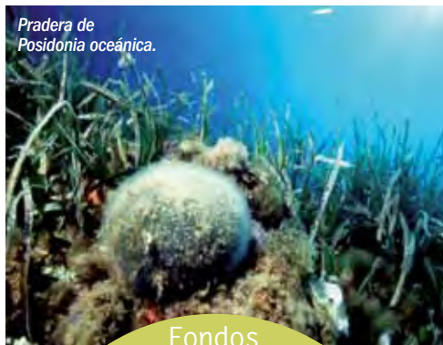
Pradera de Posidonia oceánica.

El pasado geológico está protagonizado por el vulcanismo que ha configurado el paisaje; y su paleoclima tropical mues-