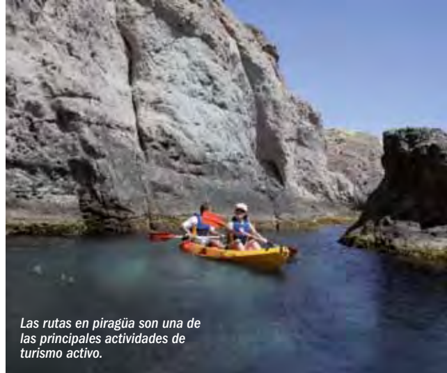
Las rutas en piragüa son una de las principales actividades de turismo activo.

El Plan de Desarrollo Sostenible plantea un ejercicio de planificación, procurando un engranaje entre las exigencias de conservación ambiental y el desarrollo económico local de una forma conjunta y compartida con la población y sus agentes sociales, económicos y cultura-