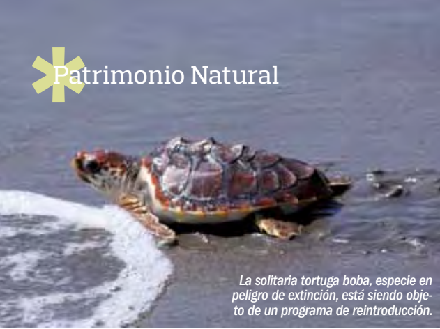
La solitaria tortuga boba, especie en peligro de extinción, está siendo objeto de un programa de reintroducción.

Dos ámbitos naturales, uno marino y otro continental, separados por una línea de costa con unas características fisiográficas impresionantes, transmiten al observador el magnetismo de una zona de especial belleza.