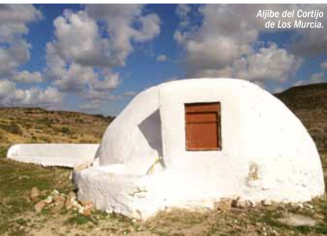
Aljibe del Cortijo de Los Murcia.

Región/Provincia biogeográfica: Región Mediterránea, provincia Murciano Almeriense, sector Almeriense, subsector Charidemo