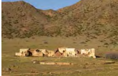
De izquierda a derecha, Presillas, Molino del Collado de los Genoveses, Cortijo El Sabinar.