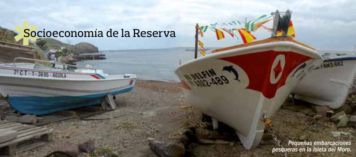
Pequeñas embarcaciones pesqueras en la Isleta del Moro.

Alrededor de 6.000 habitantes se reparten 30 entidades de población, Cabo de Gata se configura como un espacio poco poblado, siguiendo los patrones de un medio hostil al hombre, donde ha sido el duro trabajo de agricultores y ganaderos el que ha ido domando un entorno que fue poblado desde antaño por mineros, pescadores, agricultores, ganaderos trashumantes y gentes dedicadas a los trabajos artesanales de cerámica, fibras naturales y telares de jarapas.