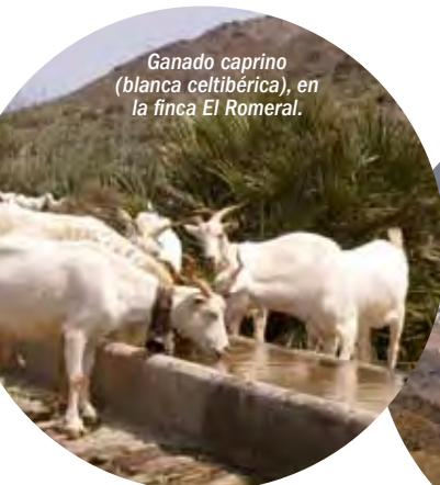
Ganado caprino (blanca celtibérica), en la finca El Romeral.

La minería, que ha sido tradicional en estas tierras, se limita hoy a la extracción de bentonitas, con numerosas aplicaciones industriales y medioambientales, y a la explotación de la sal, gracias a la cual se mantiene un Humedal de Importancia Internacional.