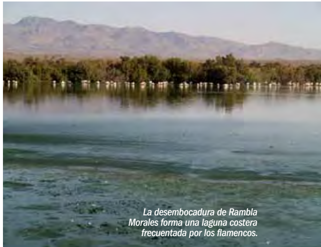
La desembocadura de Rambla Morales forma una laguna costera frecuentada por los flamencos.

Es un lugar con un encanto especial para la navegación, con acantilados en los que reposan cormoranes, gaviotas y un mundo submarino con una rica comunidad bentónica cuando el fondo es rocoso, y con valiosas praderas de fanerógamas cuando es arenoso. Praderas que sirven de refugio a especies tan emblemáticas como la nacra o el caballito de mar.