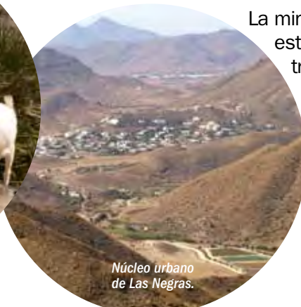
Núcleo urbano de Las Negras.