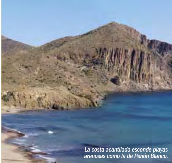
La costa acantilada esconde playas arenosas como la de Peñón Blanco.

Debido a sus especiales características, la comarca ha sido tradicionalmente un lugar escasamente poblado, dedicado a una economía sustentada en la pesca, la agricultura, la ganadería y la minería. En los últimos años, al abrigo de la catalogación del espacio como protegido, con la mejora de las infraestructuras, el auge turístico y la explotación hortícola en los Campos de Níjar, la situación ha cambiado, al haber mejorado notablemente los indicadores socioeconómicos y de calidad de vida y lo que fuera un lugar deshabitado y de baja renta per cápita, se ha convertido en uno de los sitios más visitados del sur de Europa.