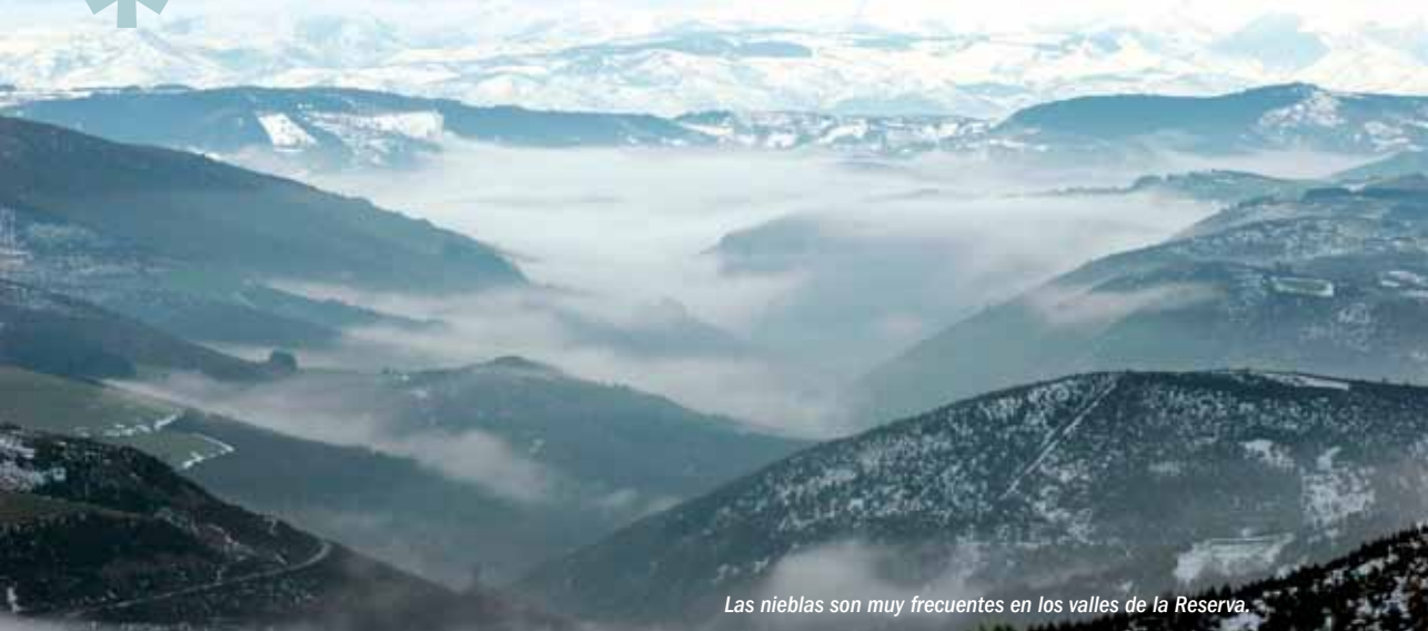
Las nieblas son muy frecuentes en los valles de la Reserva.

Las Reservas de la Biosfera se configuran como espacios que, además de ser representativos de determinados ámbitos biogeográficos o de tener relevancia para la conservación de la biodiversidad, deben ofrecer posibilidades de ensayar y demostrar modelos de sostenibilidad.