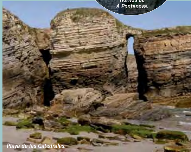
Playa de las Catedrales.

sustentar su crecimiento a medio plazo. La ganadería ha sufrido una especialización con diferencias entre municipios: la zona interior se ha especializado en vacuno de carne, mientras que en el litoral hay predominio del vacuno de leche. Además, han comenzado a manifestarse algunas iniciativas de diversificación de la actividad, como agricultura y ganadería ecológica, viveros e invernaderos, diversificación en servicios, acuicultura o actividades agroalimentarias.