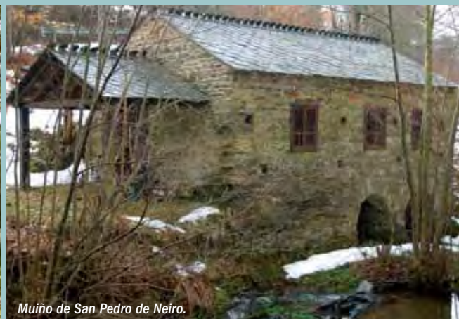
Muiño de San Pedro de Neiro.