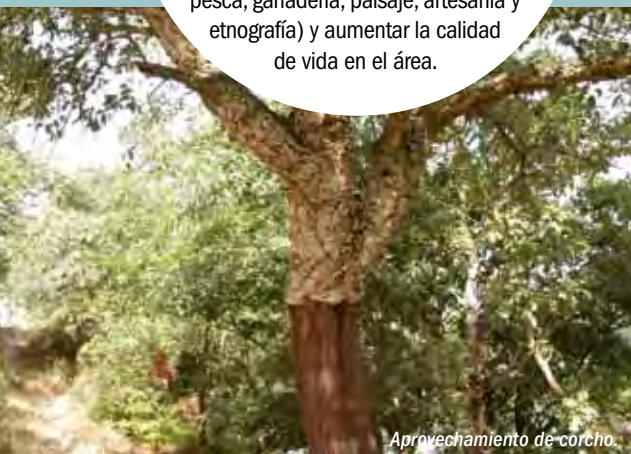
Aprovechamiento de corcho.

Las actuaciones llevadas a cabo en la Reserva a partir del conjunto de programas autonómicos y comunitarios han fomentado un modelo de desarrollo económico y social basado en el principio del desarrollo sostenible, que trata de revalorizar los recursos existentes (agricultura, silvicultura, pesca, ganadería, paisaje, artesanía y etnografía) y aumentar la calidad de vida en el área.