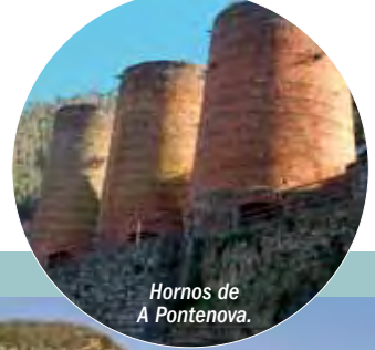
Hornos de A Pontenova.