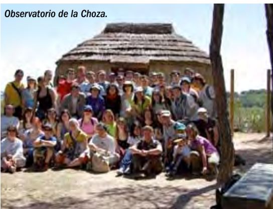
Observatorio de la Chozo.