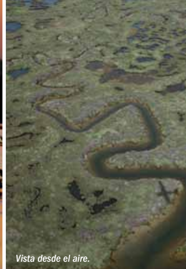
Vista desde el aire.