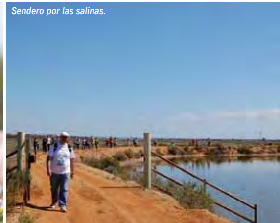
Sendero por las salinas.