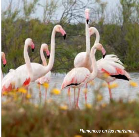
Flamencos en las marismas.

En sus 4 municipios vive más del 50% de la población total de la provincia de Huelva, con la impronta que ello supone para la Reserva, que además se sitúa fronteriza con zonas industriales y portuarias. Es, por tanto, de vital importancia para la conservación de los valores naturales, culturales y etnográficos, la implicación de las diferentes Administraciones Públicas, agentes sociales y ciudadanos en el conocimiento, aprovechamiento y disfrute de los recursos que este lugar ofrece.