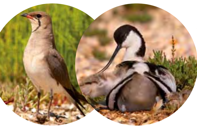
Canastera y Avoceta