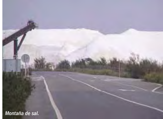
Montaña de sal.

Punta Umbría presenta un gran interés turístico. Sus playas, unidas a la gastronomía, hacen de ella un destino atractivo al que se le añade el valor de la cercanía a la Reserva, que hasta hace unos años no se incluía dentro de esta oferta turística. En Aljaraque se está desarrollando un gran Parque Científico y