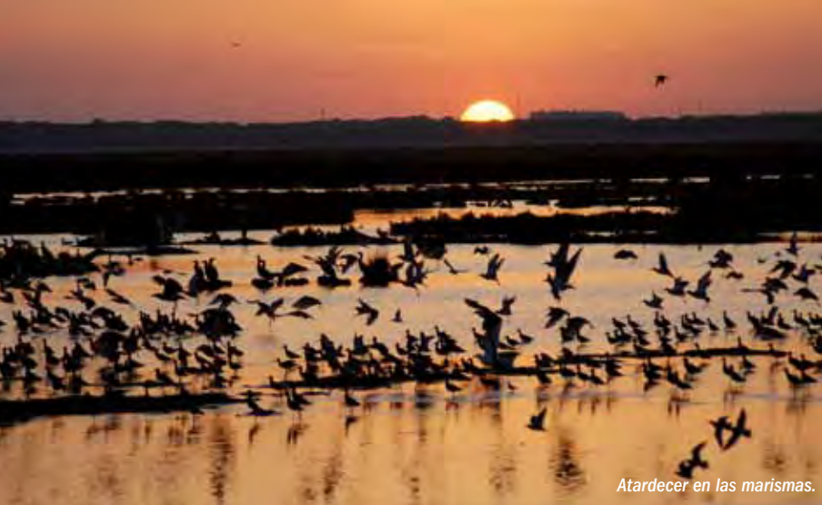
Atardecer en las marismas.