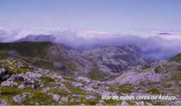
Mar de nubes cerca de Ándara.