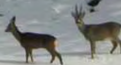
Pareja de corzos en la nieve.

La gran diversidad paisajística y florística se traduce en una variada fauna, incluyendo especies de todos los niveles de la cadena trófica. La dificultad de acceso a algunas zonas de los Picos de Europa antes de dotarles de un régimen de protección ha permitido la subsistencia de estas especies.