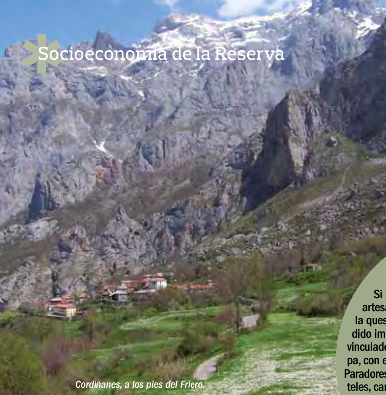
Cordiñanes, a los pies del Fríero.

Dentro del ámbito de la Reserva existen 20 poblaciones, todas ellas pequeños pueblos de montaña, con arquitectura tradicional en piedra y espléndidos paisajes.