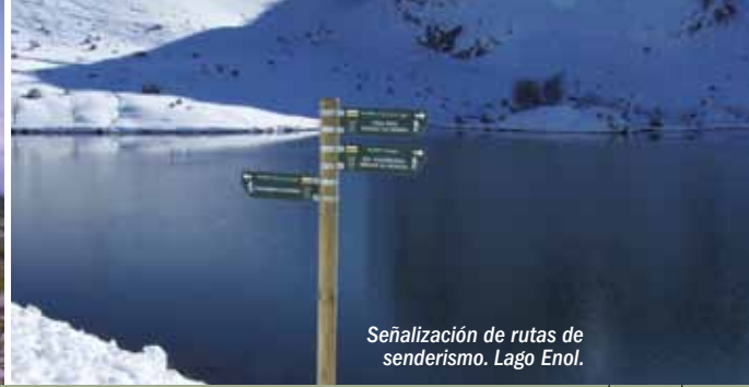
Señalización de rutas de senderismo. Lago Enol.