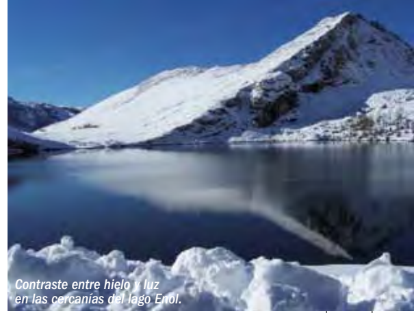
Contraste entre hielo y luz en las cercanías del lago Enl.

El uso ganadero implicaba una transferencia donde los pastores se desplazaban a los pastos de altura a finales de abril, permaneciendo en ellos todo el verano elaborando quesos. Algunos