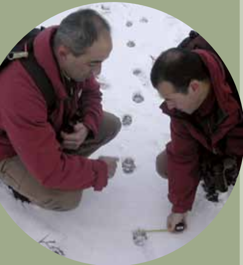
Huellas de lobo.

Picos de Europa se considera como un auténtico laboratorio para el seguimiento del cambio global y específicamente del cambio climático, con una amplia red de estaciones de control, así como para el desarrollo de sistemas de atenuación y adaptación.