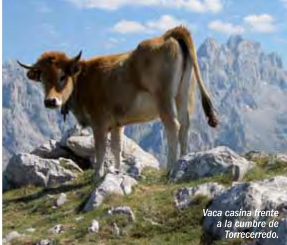
Vaca casina frente a la cumbre de Torrecerredo.

Tradicionalmente, los pastos de altura de los Picos de Europa han sido utilizados por los habitantes de este territorio para apacentar sus ganados en verano, desplazándose a unos pequeños poblados de altura, las "majadas", a las que se trasladaba la familia entera, con los enseres imprescindibles y la cabaña ganadera, en los meses de verano. Este pastoreo tradicional ha conformado un paisaje de singular belleza, en el que se funden el azul del cielo, el blanco de las nieves, el gris de los mullones calizos de las cumbres y el verde de los bosques y las extensas praderías que les orlan.