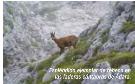
Espléndido ejemplar de rebeco en las laderas cántabras de Ádara.

pastores de la vertiente asturiana mantienen este esquema.