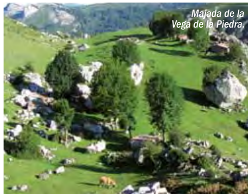
Majada de la Vega de la Piedra.

Los núcleos de importancia a nivel comarcal son Cangas de Onís, en la vertiente asturiana, auténtica puerta a los Picos y punto de paso obligado para acceder a los Lagos de Covadonga y al Santuario de Covadonga, uno de los más importantes centros de peregrinación mariana de España. La vertiente cántabra de la Reserva cuenta con menos poblaciones dentro de la misma (Fuente Dé, otro gran atractivo de los Pi-