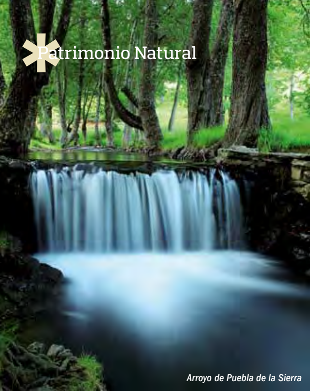
Arroyo de Puebla de la Sierra