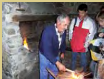
Fragua de Puebla de la Sierra

sias, las construcciones comunitarias y agropecuarias y la red de regueras son un admirable legado histórico de altísimo interés, herencia de un pasado agrícola y ganadero aún perceptible.