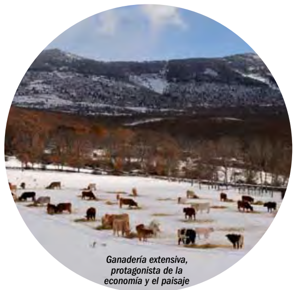
Ganadería extensiva, protagonista de la economía y el paisaje

La gestión forestal de los montes, la recuperación de variedades hortofrutícolas de la zona, el desarrollo de un modelo de ganadería ecológica y la profesionalización de los empresarios del sector turístico son oportunidades de desarrollo equilibrado y sostenible.