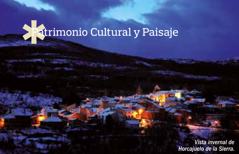
Vista invernal de Horcajuelo de la Sierra.