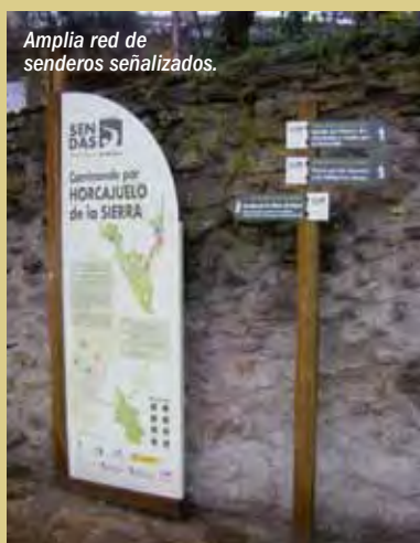
Amplia red de senderos señalizados.

Desde el año 1992, la ETSI de Montes de la UPM se ha centrado en el estudio y seguimiento del Hayedo de Montejo. Los trabajos realizados por los equipos de investigadores han aportado el conocimiento necesario para aplicar a este espacio una gestión equilibrada, basada en principios científicos, que permita la conservación de sus estructuras forestales más frágiles.