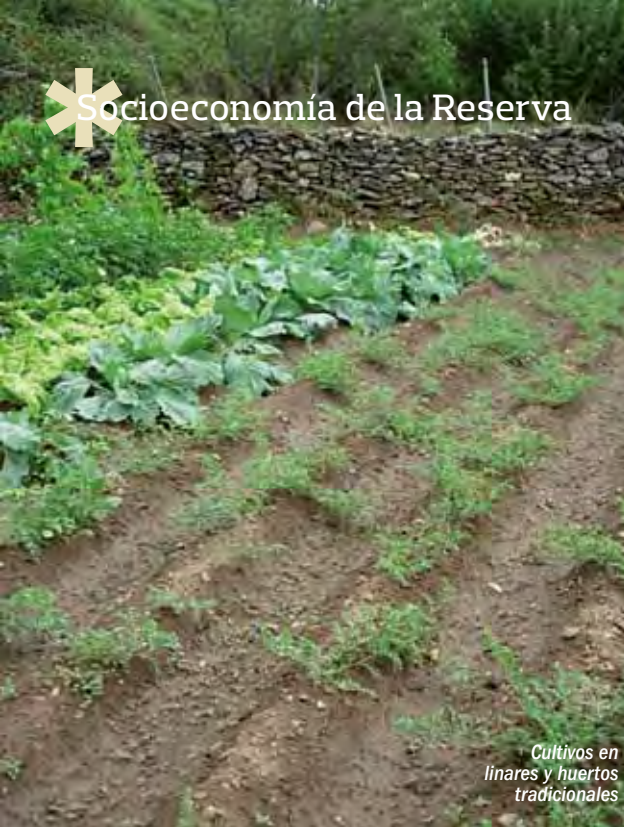
Cultivos en líneares y huertos tradicionales

Al igual que en el resto de la geografía española, los municipios de la Sierra del Rincón sufrieron en la década de los 60 del siglo pasado un fuerte despoblamiento. Sin embargo, la tendencia de los últimos años refleja una ligera recuperación poblacional que ha llevado a que la población empadronada ascienda en los últimos años a más de 700 habitantes.