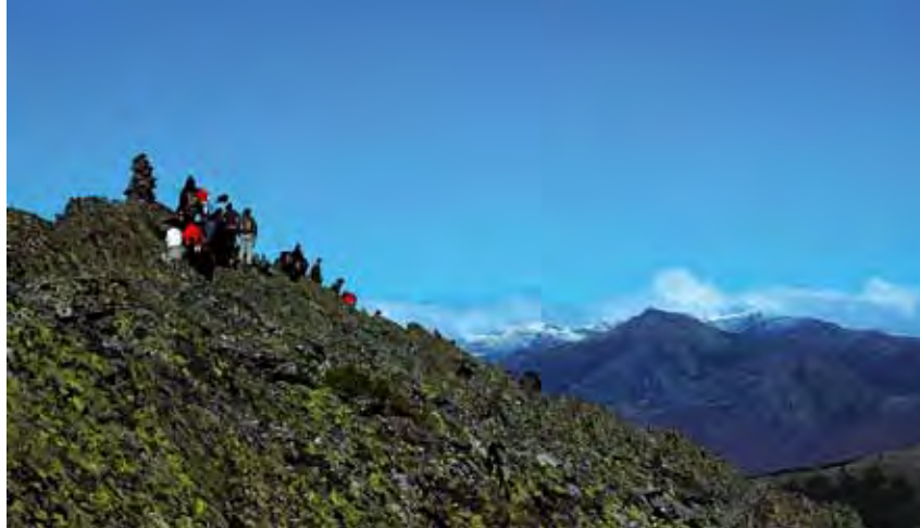
Sendas de educación y sensibilización ambiental. Peña la Cabra.