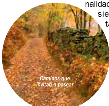
Caminos que invitan a pasear

siempre dispuestas a atender al visitante que se acerca su tierra.