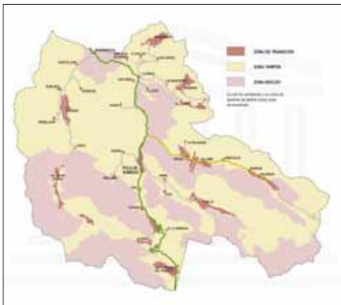
Mapa de la reserva de la biosfera de somiedo.

El Centro tiene una sala de audiovisuales y una exposición didáctica sobre los valores y recursos del Parque. Se organizan actividades de educación ambiental,