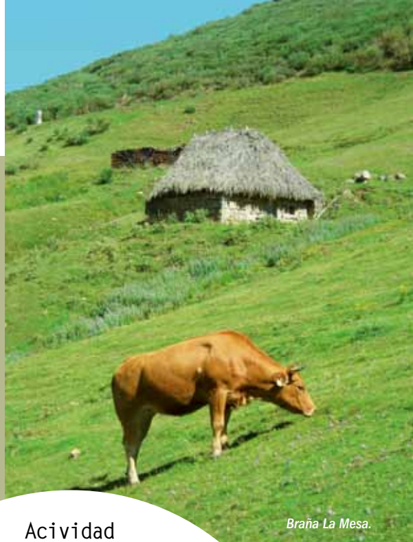
Braña La Mesa.

A su valioso patrimonio natural, Somiedo une un acervo cultural y humano no menos singular, habiendo convivido a través de los siglos dos grupos humanos social y culturalmente diferenciados: vaqueiros de alzada y xaldos.