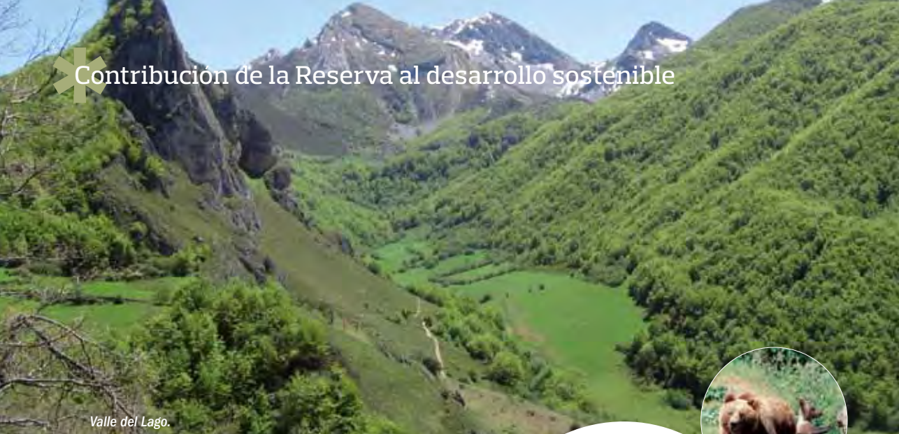
Valle del Lago.

La Reserva de la Biosfera de Somiedo es el ejemplo más claro de lo que significó la apuesta por basar el futuro de una comarca en la conservación y la explotación sostenible de su riqueza natural. Somiedo es un concejo de montaña de economía tradicionalmente ganadera, privilegiado por una agreste naturaleza cuyo mejor representante es el oso pardo. El Parque Natural de Somiedo nació, según recoge su declaración de Parque Natural, con la finalidad de “garantizar la conservación de los cualificados valores naturales del área, haciéndolos compatibles con el mantenimiento y mejora de las actividades tradicionales, con el desarrollo económico y social de la zona y con el fomento y disfrute de dichos valores”.