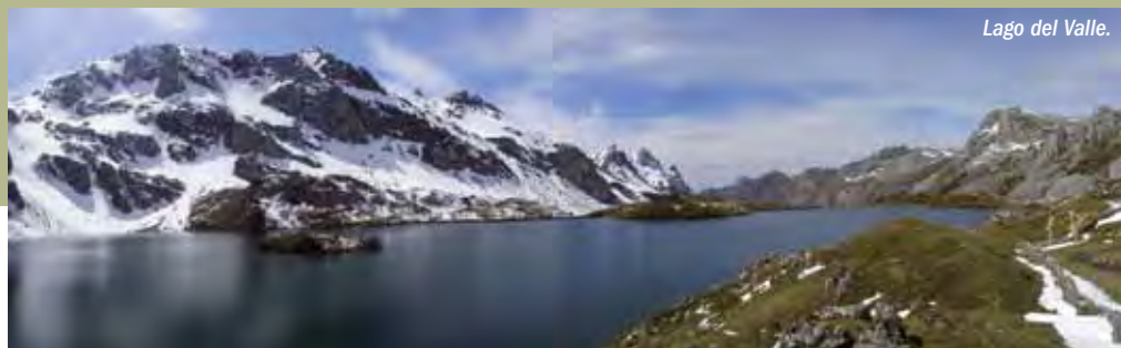
Lago del Valle.