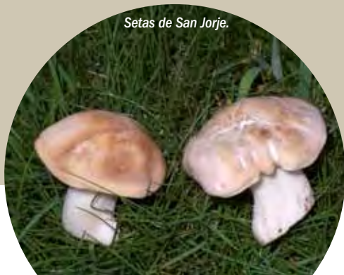
Setas de San Jorge.

Los ríos, el Embalse de Luna y demás zonas húmedas permiten la existencia de poblaciones de aves acuáticas, como anátidas, rállidas o ardeidas; nutrias y, cómo no, la trucha común, uno de los mayores atractivos turísticos.