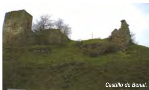
Castillo de Benal.

las vegas de los ríos, y la necesidad de pequeñas huertas de autoconsumo, ofrecen mosaicos únicos de la montaña leonesa. Algunas vistas de singular belleza se encuentran en Barrios de Luna, con el embalse acompañado de grandes calizas tapizadas de sabinas, o Cueto Rosales, donde las vistas de Omaña y sus bosques son espectaculares. Todas invitan a participar de unos paisajes únicos.