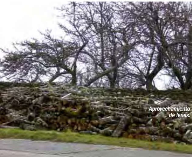
Aprovechamiento de leñas.

Un turismo bien gestionado, y el fomento de la ganadería y la agricultura, deben ser las herramientas que permitan alcanzar un desarrollo sostenible. La declaración como Reserva de la Biosfera está siendo un aliciente más a sumar a los muchos que ofrece esta tierra.