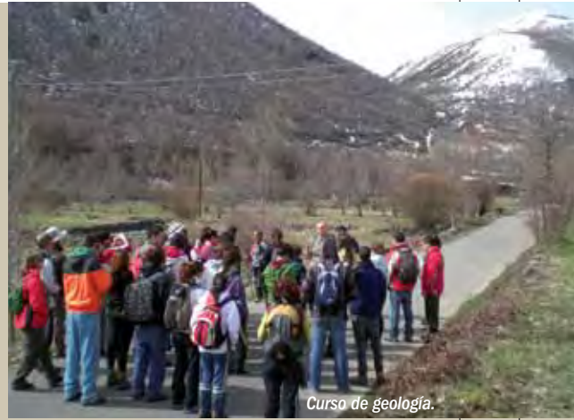
Curso de geología.

2. “Estudio del estado de conservación de las masas boscosas en función de los aprovechamientos tradicionales e implicación de la población en los procesos participativos de la Reserva”, 2010-2011, actualmente en proceso de desarrollo, pretende aportar modelos que permitan la conservación de las masas arboladas y facilitar nue-