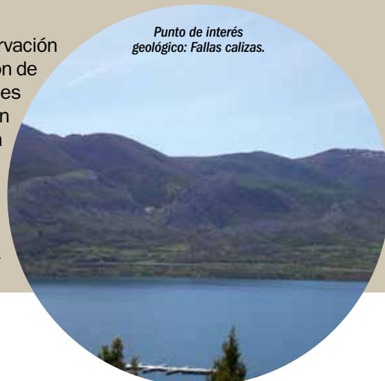
Punto de interés geológico: Fallas calizas.

3. Por otro lado, se están llevando a cabo distintos Convenios entre el Ministerio de Medio Ambiente y Medio Rural y Marino, (2008, 2009, 2010), destacando las numerosas actuaciones que se están desarrollando para la recuperación de patrimonio etnográfico, de recuperación de paisaje, y de puesta en valor del territorio.