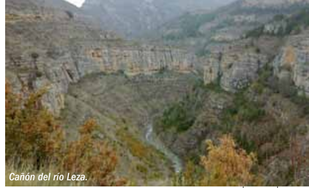
Cañón del río Leza.

La presencia del hombre celtíbero en la Reserva tiene su gran exponente en el poblado de Contrebia Leukade, en Aguilar del río Alhama, con asentamientos desde la Edad del Hierro (s. X a. C.) y celtí-