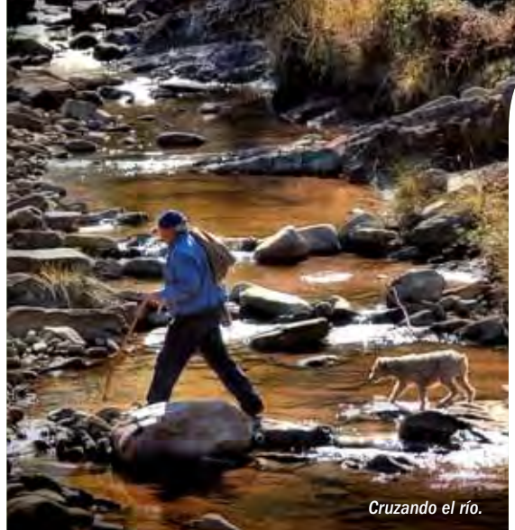
Cruzando el río.